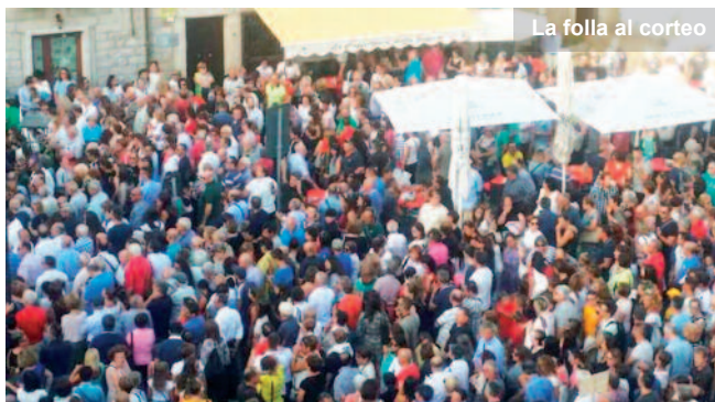
La folla al corteo