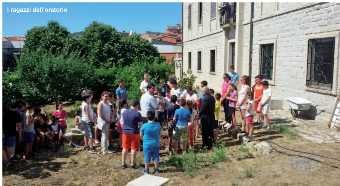
I ragazzi dell'oratorio

quale i piccoli potranno creare un piccolo orto basato sui principi di sostenibilità della permacultura (un metodo di coltivazione che crea mini ecosistemi naturali, in grado di mantenersi autonomamente e di rinnovarsi con un basso impiego di energia). I due laboratori "mani in pasta", dove con farina e fantasia i bambini impareranno a impastare per creare il pane, la pizza e appunto la pasta. Si planterà un albero in un'area verde vicina all'oratorio, si andrà a vedere come viene estratto il sughero, ci sarà il riciclo creativo e la produzione del sapone. Senza dimenticare il laboratorio teatrale, dove i bambini si metteranno nei panni di un altro essere vivente con lo scopo di promuoverne la tutela e favorirne il rispetto. Altra proposta sarà quella legata alla pet therapy, con il laboratorio "l'amico asino". Qui i bambini avranno la possibilità di stare con gli asini, in modo da rilassarsi, socializzare e migliorare la qualità della vita promuovendo la corretta interazione uomo-animale. Tutto questo sarà realizzato, ovviamente, anche grazie al lavoro dei ragazzi del gruppo giovani della parrocchia cattedrale di San Pietro e agli animatori adulti dell'Oratorio Don Mureddu. ■