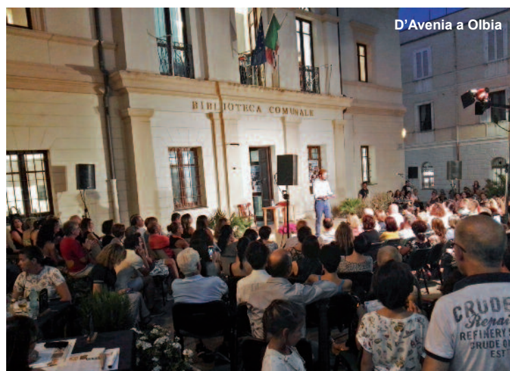
D'Avenia a Olbia

suo ruolo professionale, quello di insegnante di liceo: "Quando qualcuno dei miei alunni mi chiede: prof. ma perchè fa sempre l'appello così lungo, non rimane tempo per il programma... " e lui, di rimando "Tu, voi, siete più importanti del programma!". Stupore e applausi fra le fila degli astanti, con non pochi insegnanti. Che contraccolpo. A seguire, dopo tante colte ed appassionanti citazioni, passando disinvoltamente da Dante a Manzoni, riattualizzati nei loro classici, l'insegnante ha sottolineato come conta di più incontrare sguardi e cuori degli alunni quindi, finalmente, è giunto a parlare del grande recanatese, protagonista del suo ultimo libro, Giacomo Leopardi, restituendoci però un ritratto inedito del grande poeta, quello sì di un animo inquieto, ma che, sin da giovanissimo, risulta - secondo D'Avenia - molto più vicino e simile di quanto si possa immaginare ai nostri ragazzi. "Abbandonate l'idea di lui come pessimista, piuttosto era un grande amante della vita e un lottatore" ha spiegato lo scrittore che, attraverso le parole e i versi del poeta recanatese, si è rivolto soprattutto agli adole-