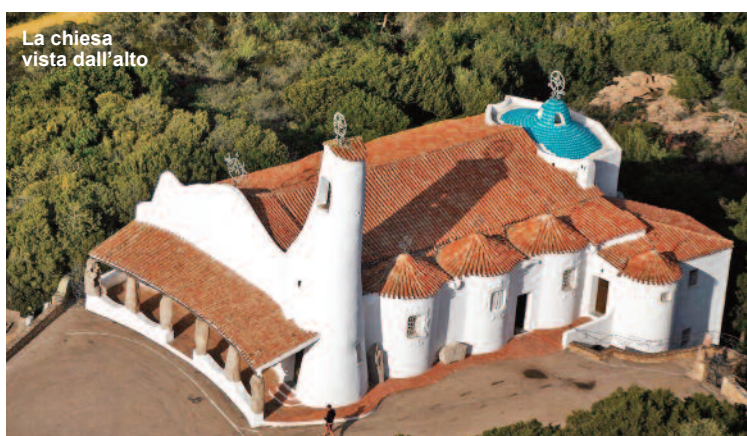
La chiesa vista dall'alto

ture verso l'esterno, che presentano una decorazione piana a volute e punte di freccia. Forme plastiche segnate, nei vuoti e nei pieni, dall'intensa luce solare, che prontamente si interrompe nel porticato della facciata e nelle coperture realizzate a coppi, fatta eccezione, come già detto, per la bassa cupola presbiteriale: unico elemento variopinto dell'edificio. Le stesse forme all'interno prendono vigore dal pavimento realizzato a mosaico in toni di granito scuro, che contrasta col candore delle superfici verticali e di copertura, da cui pendono ampie lampade a campana con pinacolo a croce in ferro battuto. L'aula è illuminata in modo soffuso attraverso le aperture laterali, mentre il presbiterio, la cui luce risulta più intensa, dalla lanterna della cupola. Oltre la straordinaria architettura, la chiesa di Porto Cervo può vantare notevoli opere d'arte, come la splendida addolorata di Domínikos Theotokópoulos, meglio noto come El Greco: uno dei massimi artisti del secondo '500 europeo.