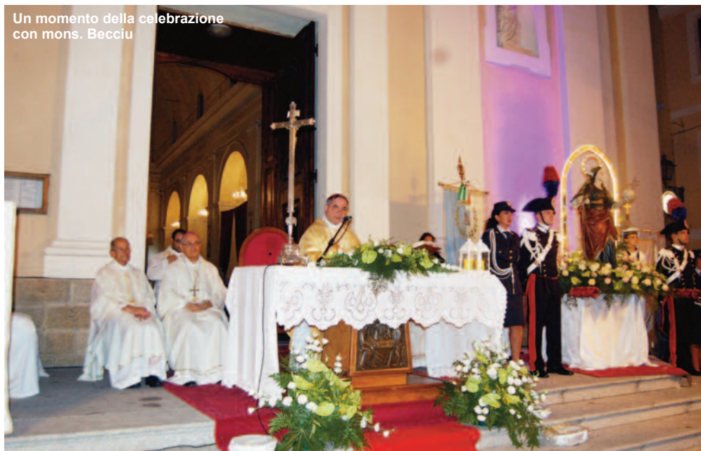
Un momento della celebrazione con mons. Becciu

dalena, patrona dell'arcipelago maddalenino, particolarmente importante perché proprio quest'anno si celebrano i 250 anni della fondazione della comunità isolana. Festa solennizzata dalla significativa presenza di monsignor Angelo Becciu, sostituito alla Segreteria di Stato vaticana. Alla concelebrazione oltre al vescovo della diocesi monsignor Sebastiano Sanguinetti e a quello di Ozieri monsignor Corrado Melis era presente anche il "primate" della Corsica monsignor Oliver de Gernay. Monsignor Becciu nell'omelia ha sottolineato l'importanza di Maria di Magdala nell'annunciare la risurrezione di Gesù, lei donna, attualizzando il suo ruolo nell'importanza che le donne rivestono e sottolineando quante siano ancora le discriminazioni nei confronti di esse. Alle celebrazioni, precedute dalla novena predicata dai sacerdoti di La Maddalena e da quelli che negli anni hanno prestato servizio nell'isola (l'ultima sera dal nostro vescovo), è stata notevole la presenza di fedeli, sia alla Messa solenne celebrata di notte sia alla processione a terra e a quella, molto suggestiva, a mare. Nutrita anche la presenza delle autorità civili e militari. (Nel prossimo numero maggiori approfondimenti su questa celebrazione). ■