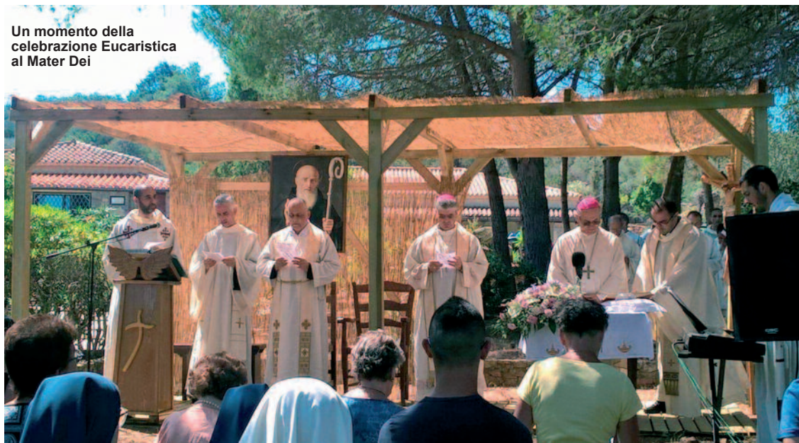
Un momento della celebrazione Eucaristica al Mater Dei

Oratorio Don Mureddu, i bambini protagonisti nella tutela dell'ambiente