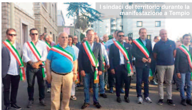
I sindaci del territorio durante la manifestazione a Tempio

coloro che lavorano a mantenere privilegi e posti di potere: a destra, a sinistra, al centro, sopra e sotto". Intanto lo scorso 20 luglio in Regione è stato trovato l'accordo per salvare i piccoli ospedali: Isili, Sorgono, Bosa, Muravera e La Maddalena avranno un reparto di medicina generale con venti posti letto, un pronto soccorso e in più un reparto di chirurgia (non previsto dal decreto ministeriale) per interventi di urgenza che prevedano un periodo di degenza compreso tra le 24 ore e i quattro giorni. ■