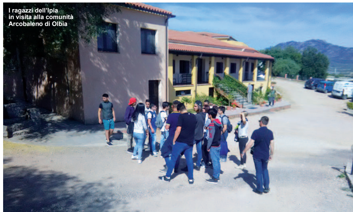
I ragazzi dell'Ipia in visita alla comunità Arcobaleno di Olbia

G li studenti dell'Ipia di Olbia incontrano la comunità Arcobaleno di don Andrea Raffatellu. "Il problema delle tossicodipendenze" è il nome del progetto realizzato all'Ipia di Olbia e scaturito dalla volontà di coniugare una disciplina come il diritto e l'economia, importante al fine della maturazione morale e civica del giovane, con una materia quale la religione cattolica altrettanto importante per il tessuto sociale in cui la Chiesa svolge la propria opera. Un modo per rinvenire un punto di contatto tra materie che potessero suscitare interesse e allo stesso tempo condurre gli studenti delle classi prime verso una riflessione sulle tossicodipendenze, una dipendenza troppo spesso diffusa e dai ri-