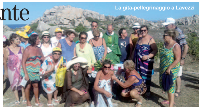
La gita-pellegrinaggio a Lavezzi

ma sabato era una giornata bellissima e, nella traversata, abbiamo potuto godere della bellezza indescrivibile del nostro mare, che sembrava veramente uno specchio. Appena arrivati abbiamo visitato il piccolo cimitero dove riposano gli uomini dell'equipaggio della fregata francese "Semillante", che la mattina del 15 febbraio 1855, sorpresi da una tempesta mentre attraversavano le Bocche di Bonifacio, si schiantarono sugli scogli proprio ad ovest dell'isola di Lavezzi e subito dopo ci siamo potuti immergere, con un bagno tonificante, nelle acque cristalline di questa selvaggia isola. Belle spiagge grandi, ma anche piccole cale sabbiose che permettono intimità, fondali trasparenti dove, facendoti il bagno, sei circondato da una miriade di pesci. Dopo l'ottimo pranzo preparato e servito a bordo della barca, condiviso e apprezzato da tutti, qualche ora di relax dove, chi vo-