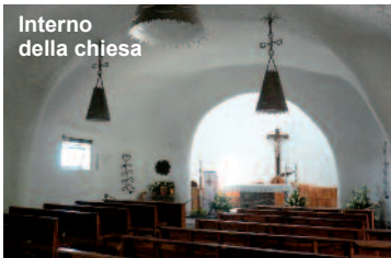
Interno della chiesa