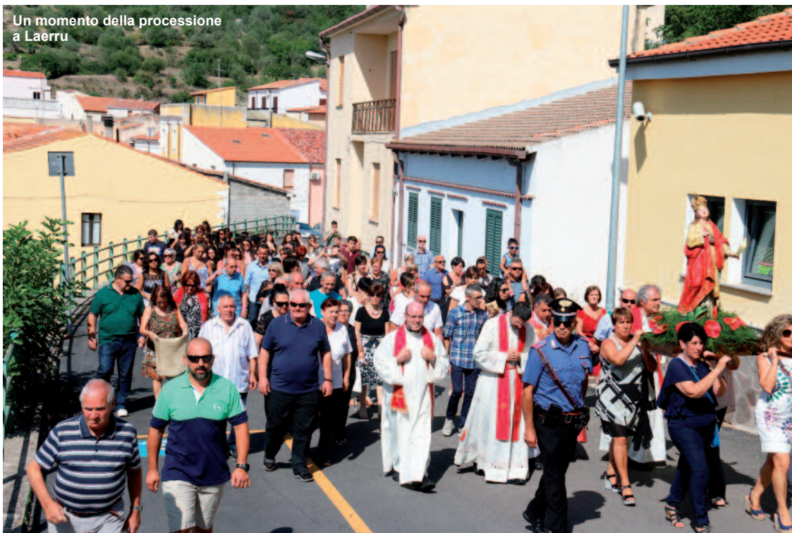
Un momento della processione a Laerru

date della festa. Sono tanti infatti coloro che hanno raggiunto la piccola comunità per rendere omaggio alla giovane Santa. Particolarmente suggestiva la processione per le vie del paese